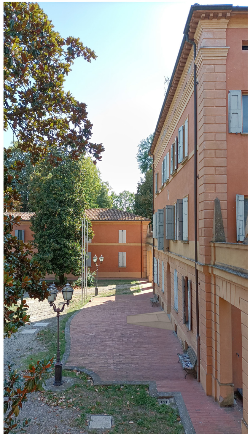
fotoinserimento: rampa su ingresso del corpo centrale